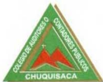
COLEGIO DE AUDITORES DE O CONTADORES PUBLICOS DE CHUQUISACA